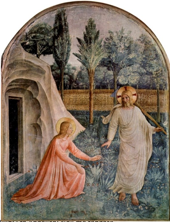
Bild: Fra Angelico: Noli me tangere

In Fra Angelicos Gemälde sehen wir den Moment, als Maria Jesus erkannt hat und ihn anfasen will (Joh 20,17). Jesus wendet sich ab mit den titelgebenden Worten: noli me tangere. Diesen sprichwörtlich gewordenen Satz, im griechischen Original heißt es: mā mou haptou, kann man auf zwei Weisen übersetzen: